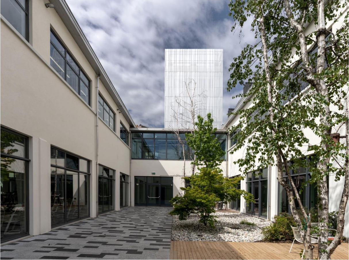
03.ISPLORA_967arch_WPP_©Andrea Martiradonna, UDB studio courtesy by Setten Genesio S.p.A