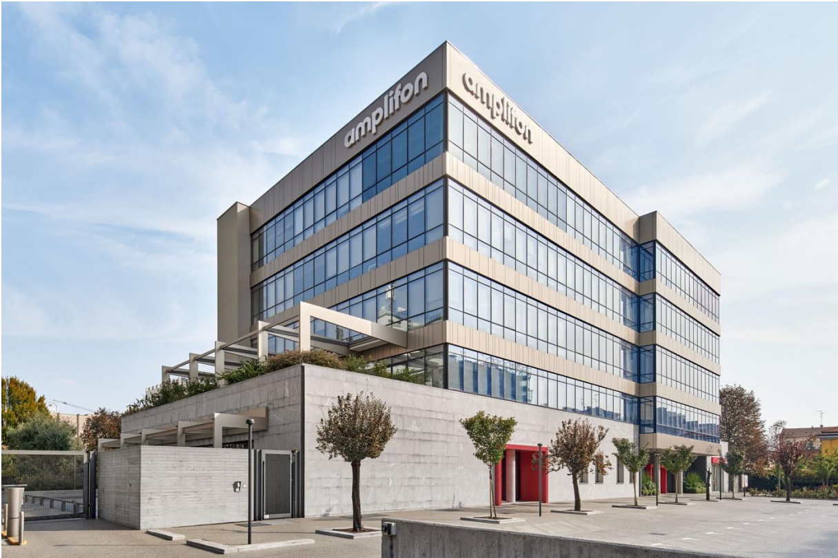
05.ISPLORA_967arch_Amplifon_©Fausto Mazza e Leo Torri