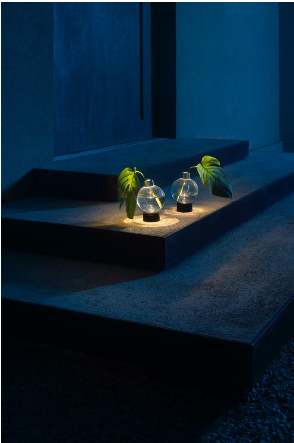
02.Isplora vesoi Punto-Linea-Superficie