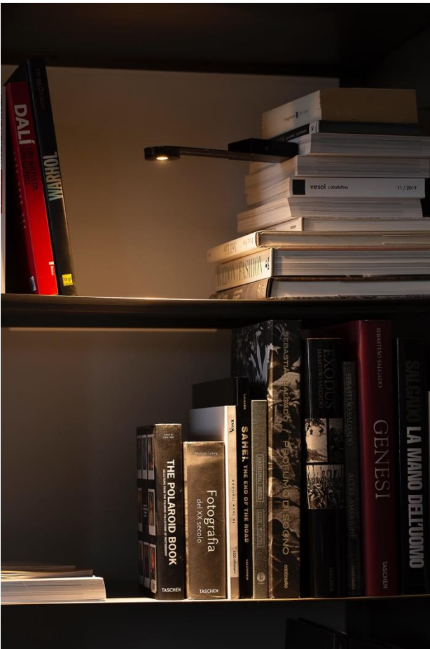
06.Isplora vesoi Punto-Linea-Superficie ©vesoi