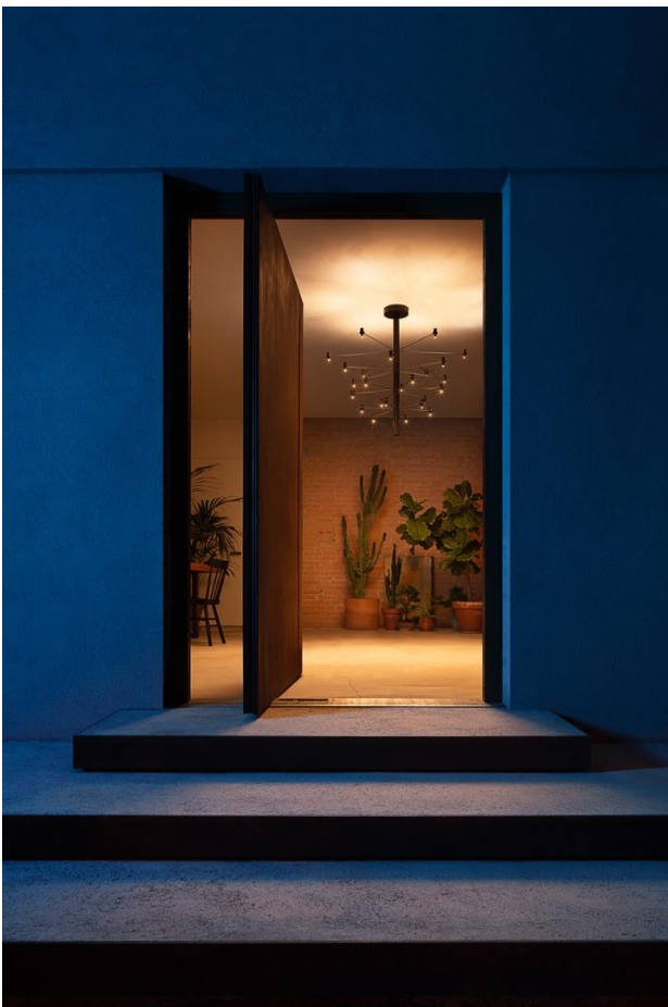
04.Isplora vesoi Punto-Linea-Superficie