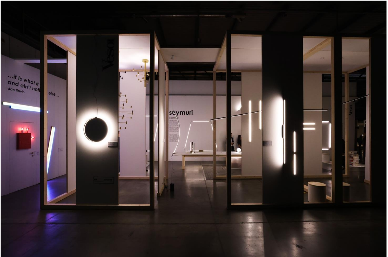
01.Isplora vesoi Punto-Linea-Superficie Euroluce 2023