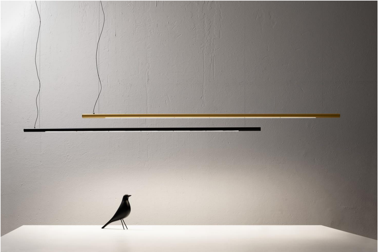
03.Isplora vesoi Punto-Linea-Superficie ©vesoi